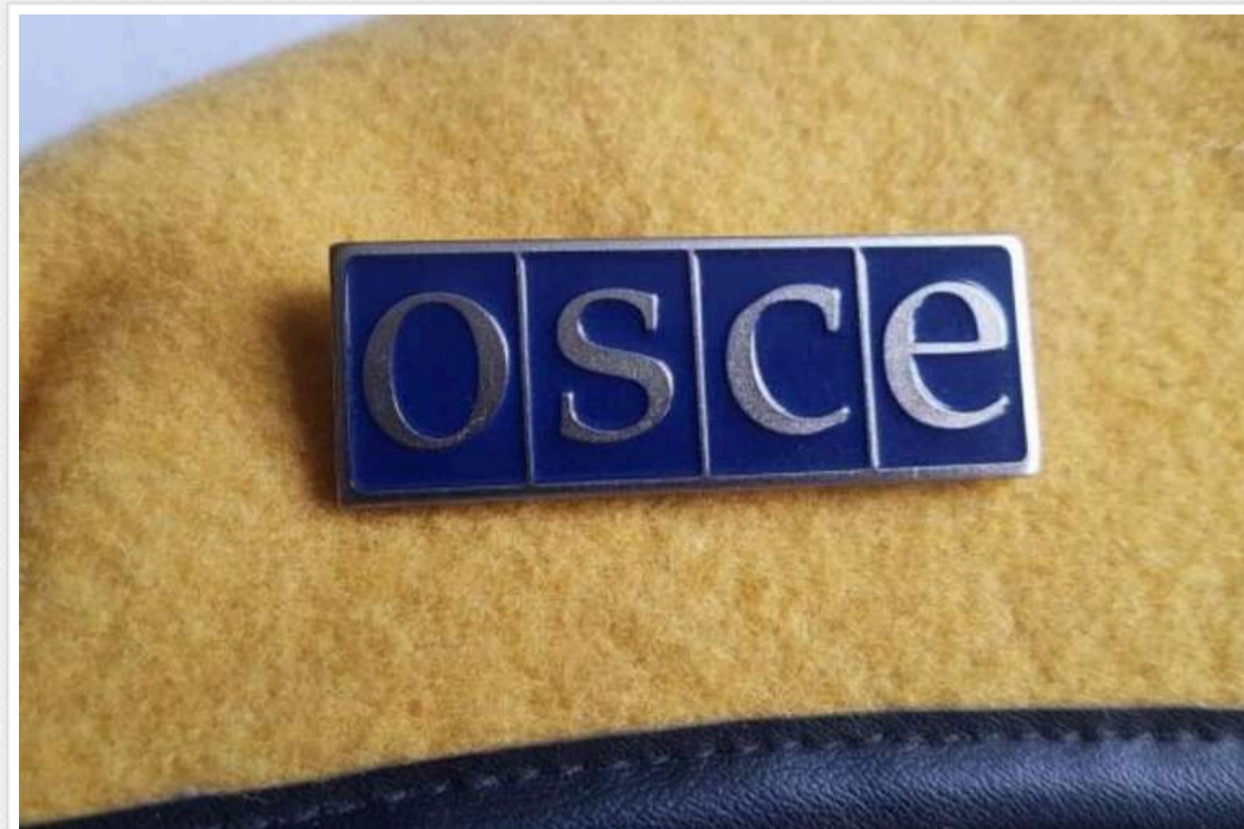
Швейцарія змагатиметься за головування в ОБСЄ у 2026 році

Міністр закордонних справ Швейцарії Іньяціо Кассіс офіційно оголосив Мальті, яка зараз очолює Організацію з безпеки та співробітництва в Європі (ОБСЄ), про намір очолити Організацію в 2026 році.