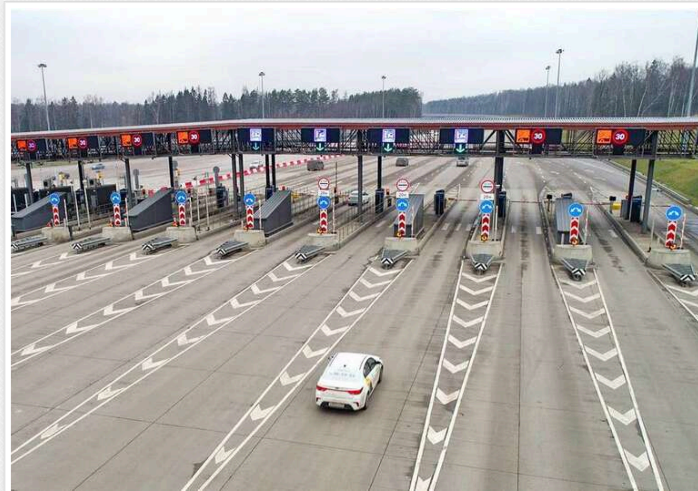
Опубліковано орієнтовні тарифи на платні дороги в Україні

В Україні планується впровадження платних доріг, що стане новим етапом у розвитку національної інфраструктури.