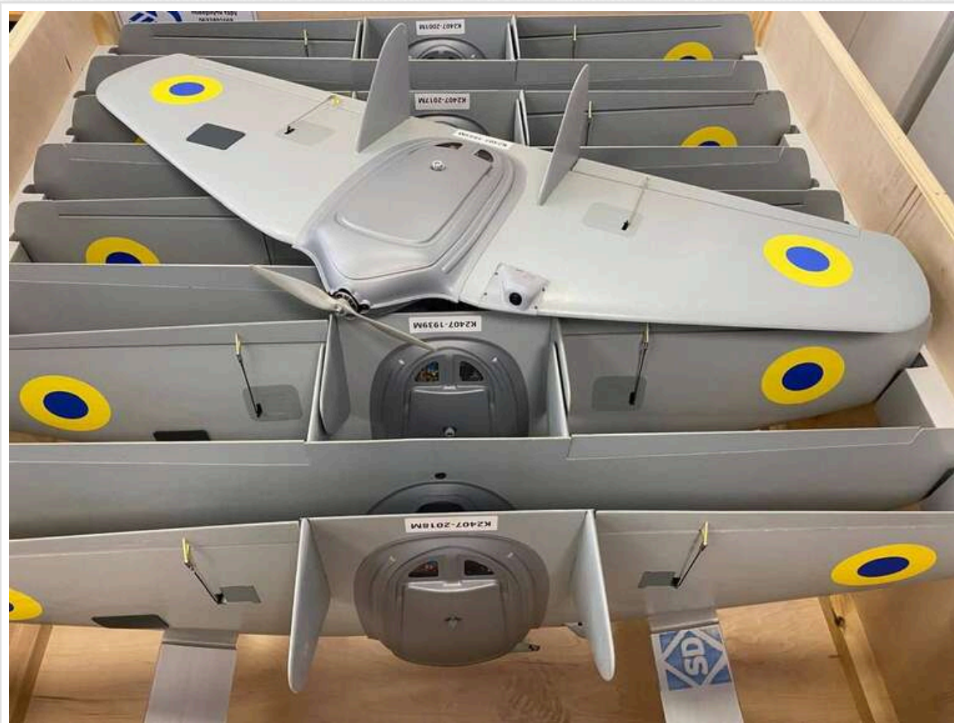
Із січня в Україну почнуть масово постачати безпілотники різних типів у масштабах "десятків тисяч" апаратів, – Люк Поллард

3 січня 2025 року "Коаліція дронів", очолювана Великою Британією спільно з Норвегією та Латвією, планує розпочати масові постачання безпілотних літальних апаратів різних типів до України.