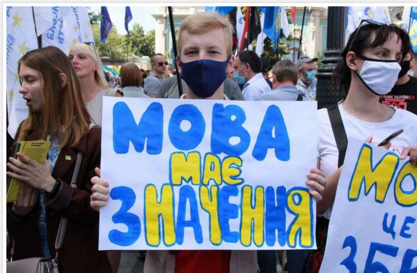
В Україні зменшився відсоток людей, які вважають українську мову рідною

В Україні спостерігається зниження відсотка людей, які вважають українську мову рідною.