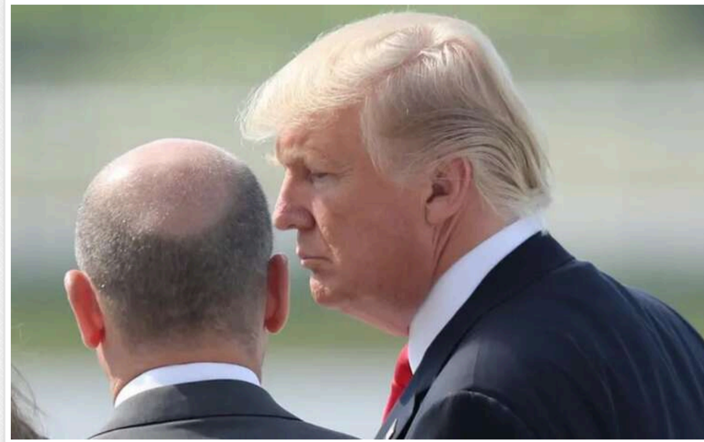
Шольц і Трамп під час розмови визнали, що війна в Україні триває надто довго і час знайти шлях до миру, – уряд ФРН

Під час нещодавньої телефонної розмови канцлер Німеччини Олаф Шольц та президент США Дональд Трамп обговорили ситуацію в Україні. Вони погодилися, що конфлікт триває занадто довго і необхідно знайти шлях до миру.