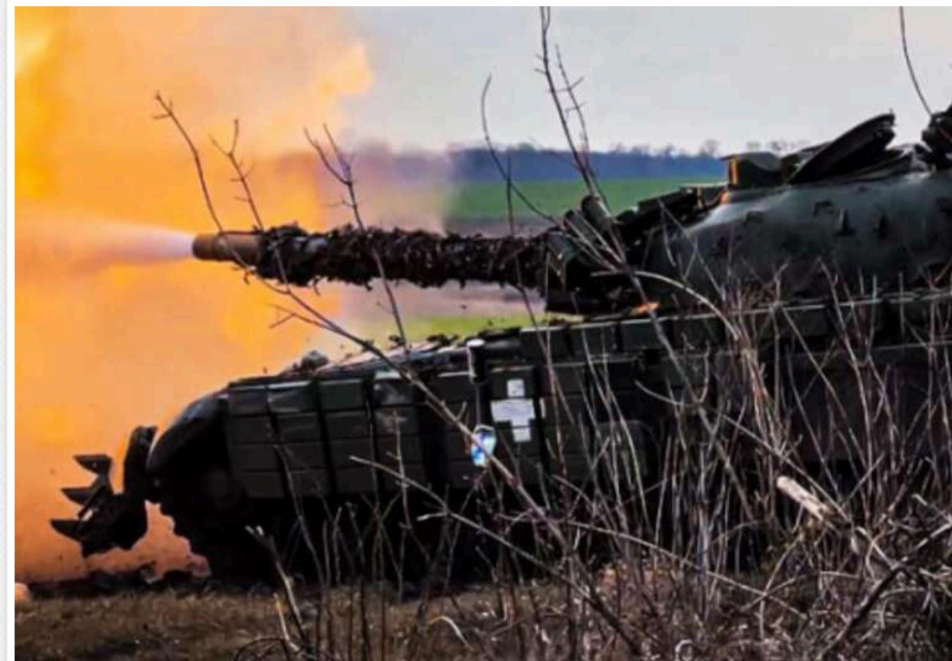
Ситуація на фронті: відбулося вже 103 зіткнення, найзапекліші бої тривають на Покровському напрямку

На фронті від початку доби відбулося 103 бойові зіткнення Сил оборони України з російськими загарбниками, найактивніше ворог атакує на Покровському напрямку.