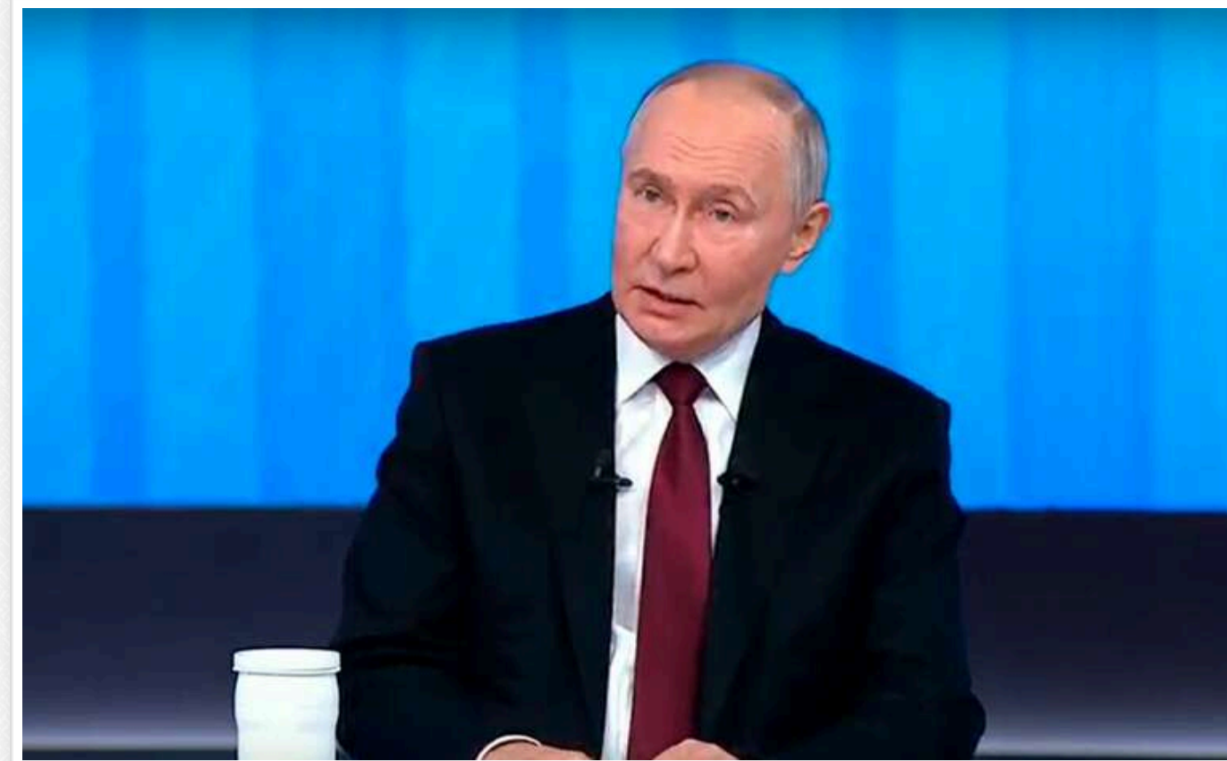
Українські телефонні шахраї видурили у росіян понад 250 мільярдів рублів

Про це заявив російський диктатор Путін під час пресконференції.