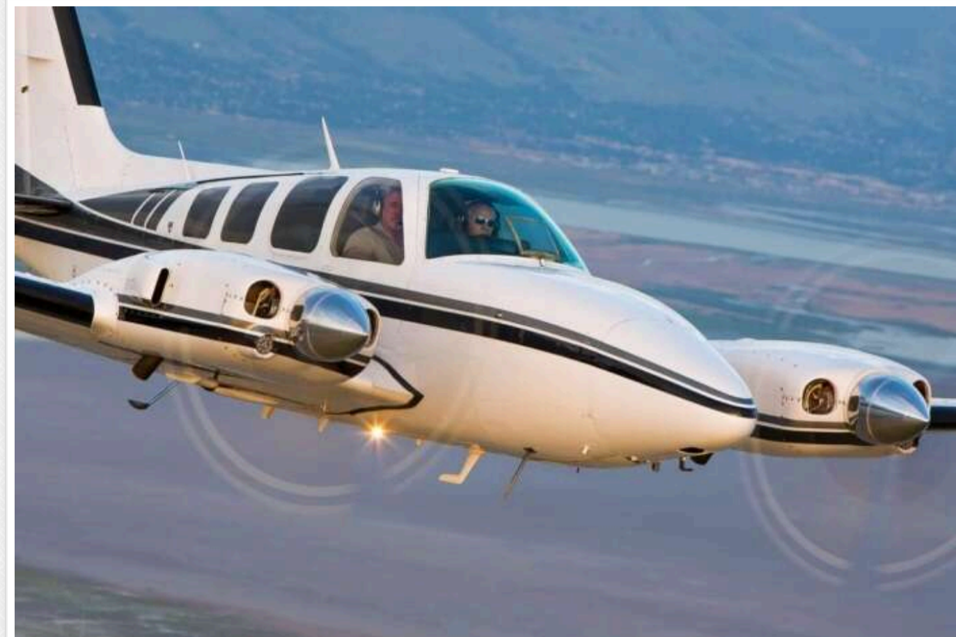
У Фінляндії за підозрою в обході санкцій затримано літак, який летів до РФ

В аеропорту Гельсінкі був затриманий литовський літак Beechcraft - через підозру у порушенні санкційного режиму. Літак збирався слідувати незвичним маршрутом до Пскова - через Гельсінкі замість прямого рейсу з Латвії.