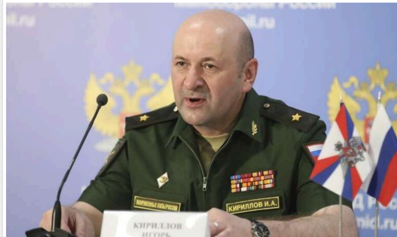
Україна намагається змусити Путіна піти на угоду ліквідацією російських діячів у тилу, - NYT

Вбивствами російських діячів у тилу Україна намагається підштовхнути Путіна до угоди, але це може, навпаки, зірвати переговори, заявив The New York Times колишній високопосадовець ЦРУ Ральф Гофф, який часто відвідує Україну.