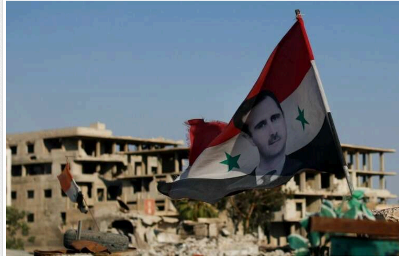
Ситуація між повстанцями, які захопили владу в Сирії, і Туреччиною продовжує загострюватися

Ситуація між повстанцями, які захопили владу в Сирії, і Туреччиною - з одного боку, а також між курдами та США, які їх підтримують, - з іншого, продовжує загострюватися.