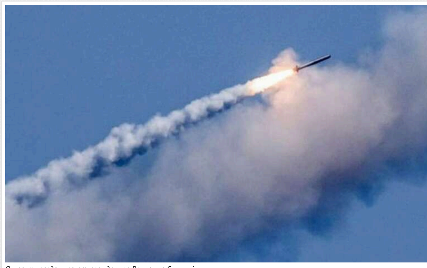
Окупанти завдали ракетного удару по Ромнах на Сумщині

Увечері 18 грудня російські загарбники завдали ракетного удару по місту Ромни на Сумщині. Внаслідок атаки було пошкоджено житлові будинки.