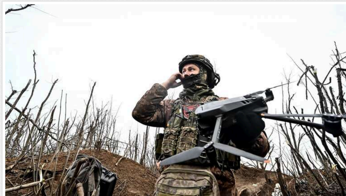
Ситуація на фронті: найбільша кількість боїв - на Покровському напрямку й у Курській області

На фронті з початку доби 18 грудня до вечора вже сталося 224 бойові зіткнення. Найінтенсивнішими з точки зору кількості ворожих атак залишаються Курська область і Покровський напрямок.