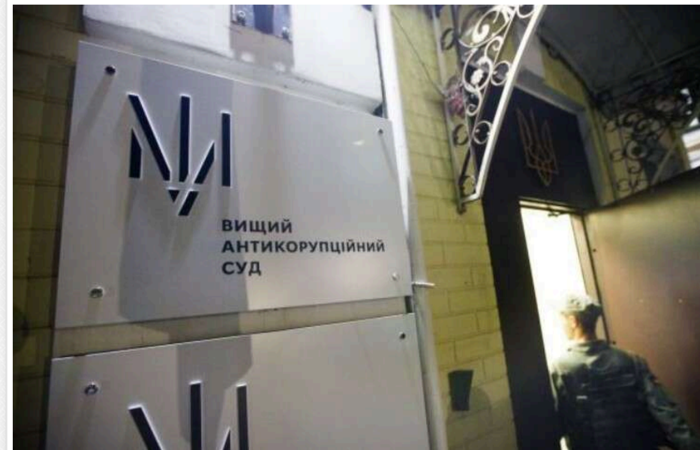
ВАКС зобов'язав НАБУ розпочати провадження щодо продажу кредитів порту "Боріваж"

Вищий антикорупційний суд зобов'язав Національне антикорупційне бюро України внести до Єдиного реєстру досудових розслідувань інформацію за заявою страхової компанії "Інгострах" щодо продажу кредитів порту "Боріваж" за заниженою ціною.