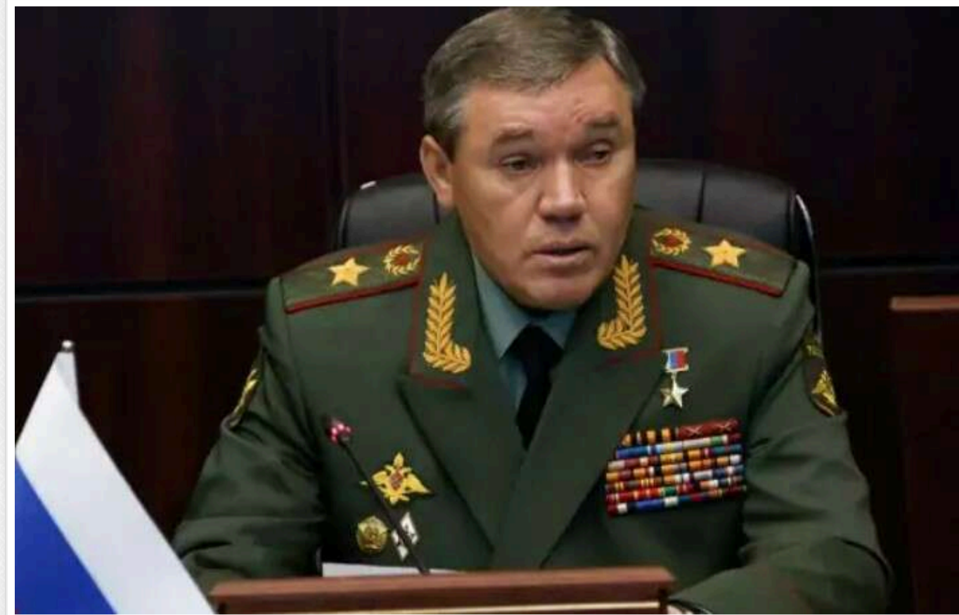
ЗМІ виявили, що начальник Генштабу ЗС РФ Герасимов знову розповсюджує фейки

Начальник Генштабу ЗС РФ Валерій Герасимов заявив, що НАТО розмістило в Данії наземний ракетний комплекс "Дарк Тіфон". Проте журналісти з'ясували, що Герасимов просто вигадав таку систему.