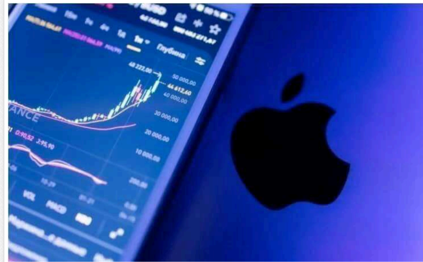
Акції Apple впевнено рухаються до ринкової вартості в 4 трильйони доларів

Акції компанії Apple продовжують демонструвати стабільне зростання, наближаючи вартість компанії до рекордної позначки в $4 трильйони.