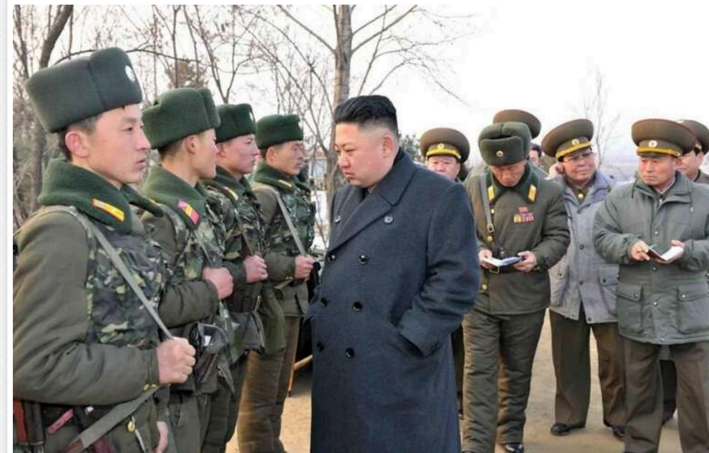
Під час боїв в Україні північнокорейські військові несуть великі втрати: понад 200 загиблих і поранених

За повідомленням Центру протидії дезінформації, на сьогодні північнокорейські війська зазнали серйозних втрат — понад 200 осіб загинуло чи зазнало поранення. Зазначається, що російські командири не цінують життя північнокорейських солдатів, ставлячи під сумнів їхню здатність вести сучасні бойові дії.