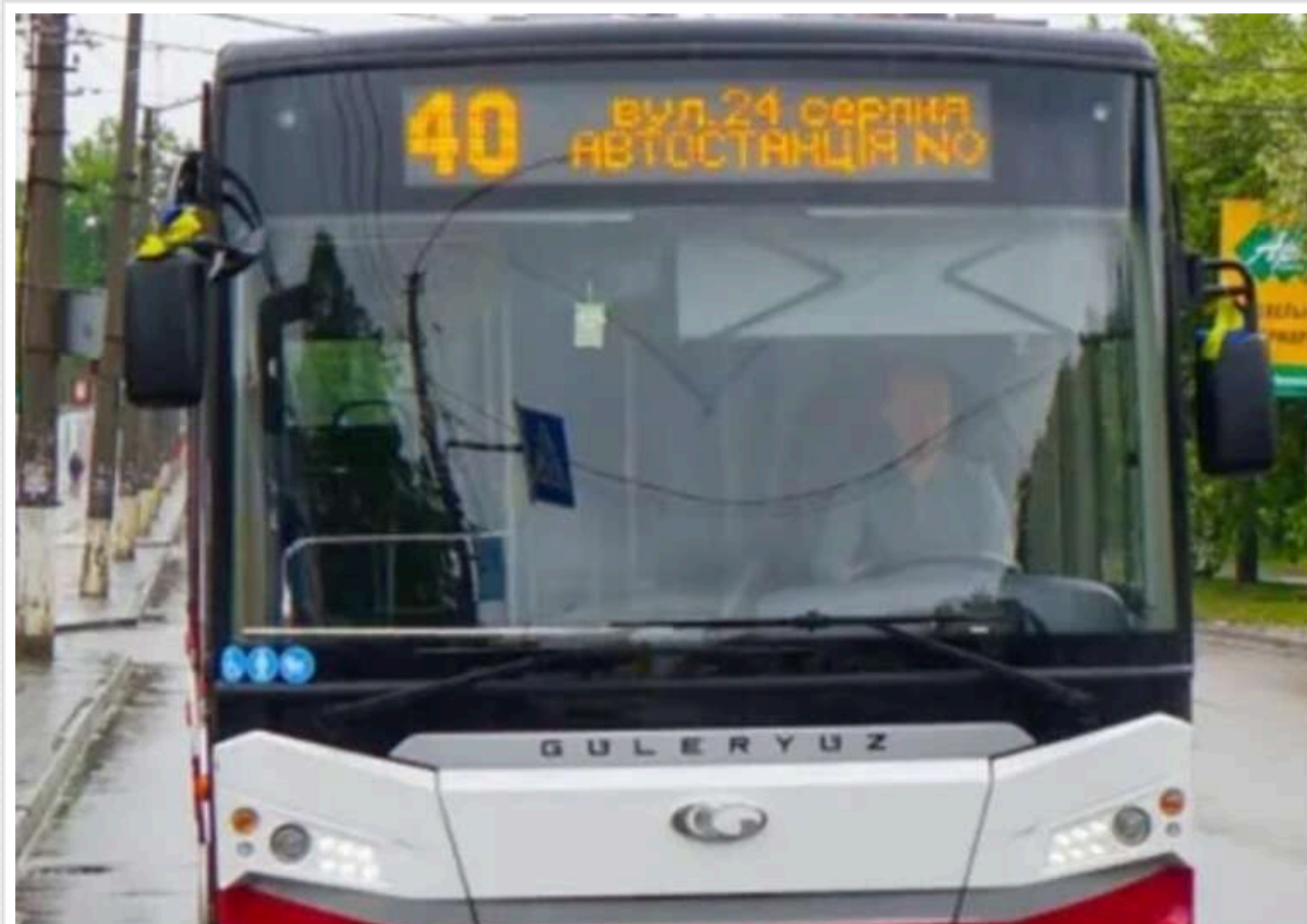
В Івано-Франківську в автобусі жінка висловлювала похвалу Путіну та називала українців "бандерівцями"

У Івано-Франківську 17 грудня виник конфлікт в автобусі, який курсує за маршрутом №40. Неадекватна жінка напала на інших пасажирів, лаялася та вигукувала побажання смерті, хвалила Путіна і називала українців "бандерівцями": заспокоювати агресивну пасажирку довелося поліції.