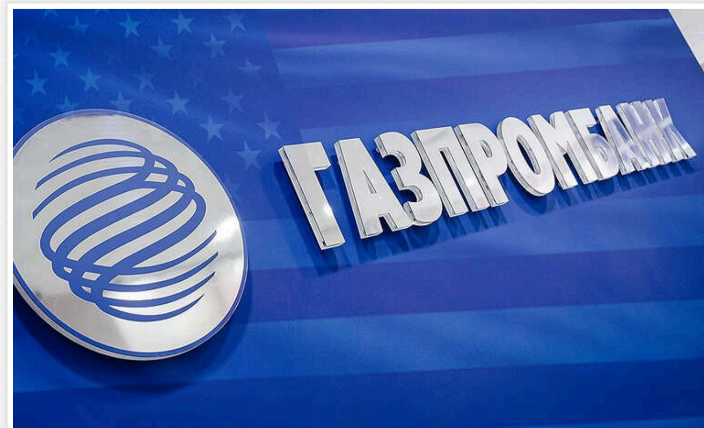
США частково зняли санкції з Газпромбанку для розрахунків у атомній енергетиці

Міністерство фінансів США частково вивело Газпромбанк із-під санкцій, дозволивши проведення операцій, пов'язаних з цивільною атомною енергетикою, до 30 червня 2025 року.