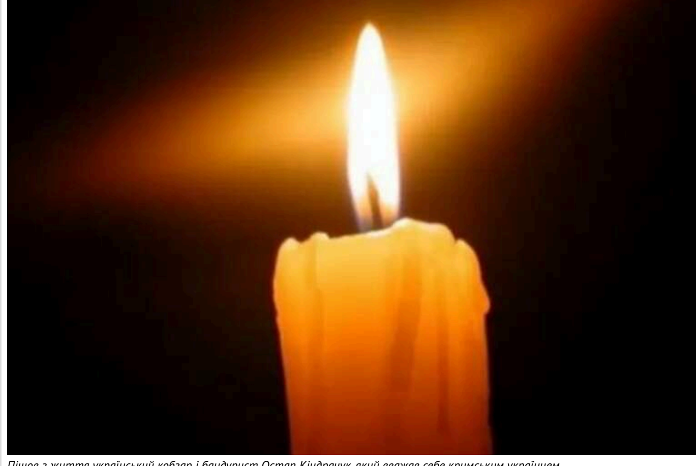
Пішов з життя український кобзар і бандурист Остап Кіндрачук, який вважав себе кримським українцем

Сьогодні, 18 грудня, пішов із життя кобзар і бандурист Остап Кіндрачук, який називав себе кримським українцем. Серце цього чоловіка, який грав на народному інструменті в казачьому вбранні на ялтинській набережній, зупинилося у 87 років.