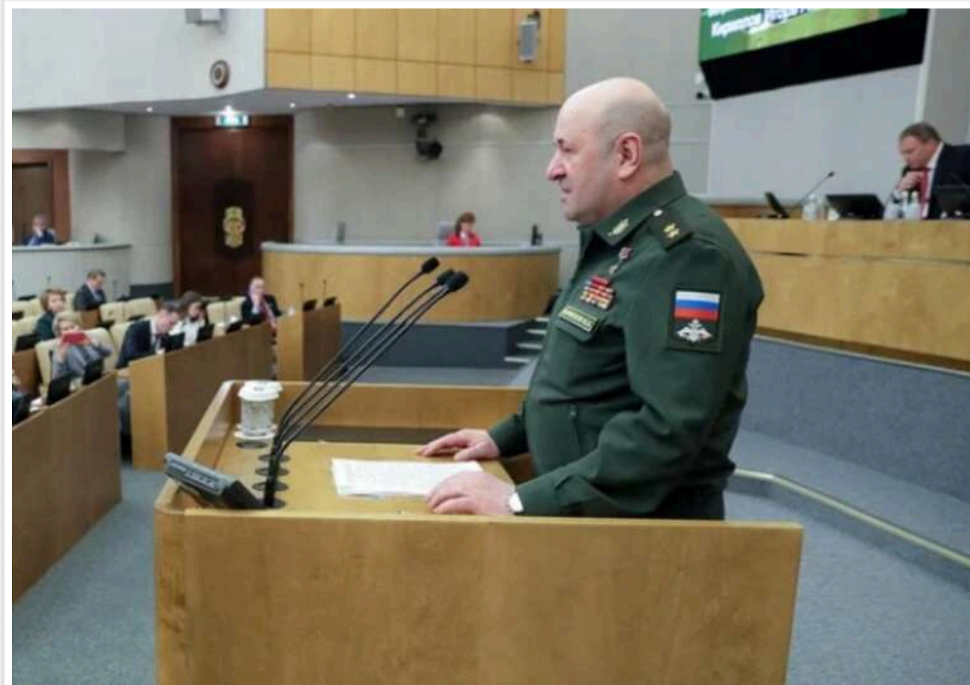
The Economist: Спецслужби України підтвердили свою "ефективність", усунувши генерала Кирилова

Ліквідувавши російського генерала Ігоря Кирилова, начальника військ радіаційного, хімічного та біологічного захисту збройних сил РФ, українські спецслужби продемонстрували свою «смертоносність» і здатність атакувати вище командування РФ навіть у Москві.