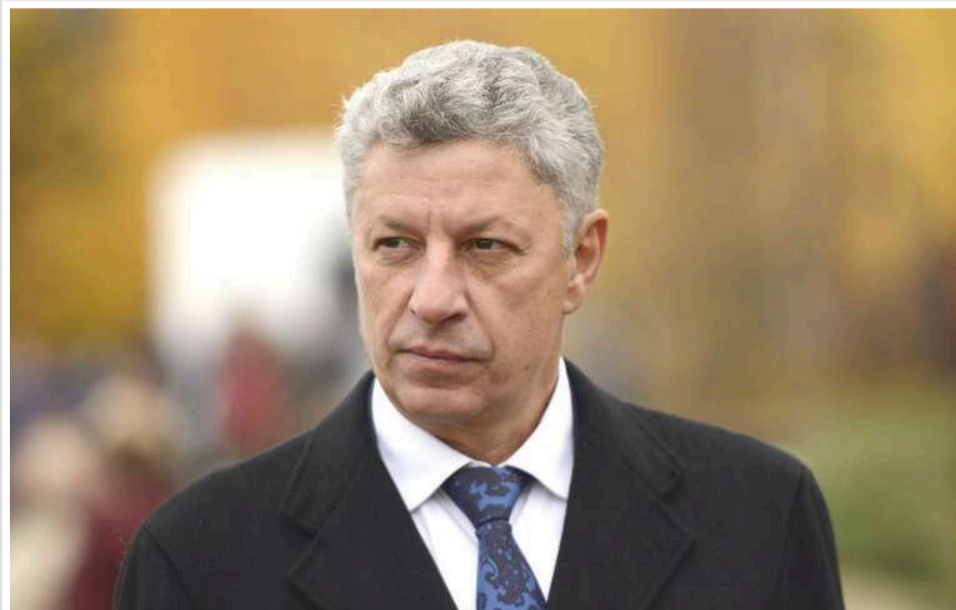
Верховна Рада не відкликала нардепа Бойка з посади члена Комітету з прав людини

Народні депутати Верховної Ради на засіданні в середу, 18 грудня, не змогли усунути проросійського політика Юрія Бойка з посади члена Комітету з питань прав людини, деокупації та реінтеграції тимчасово окупованих територій України, національних меншин і міжнаціональних відносин. "За" проголосували лише 217 народних обранців.