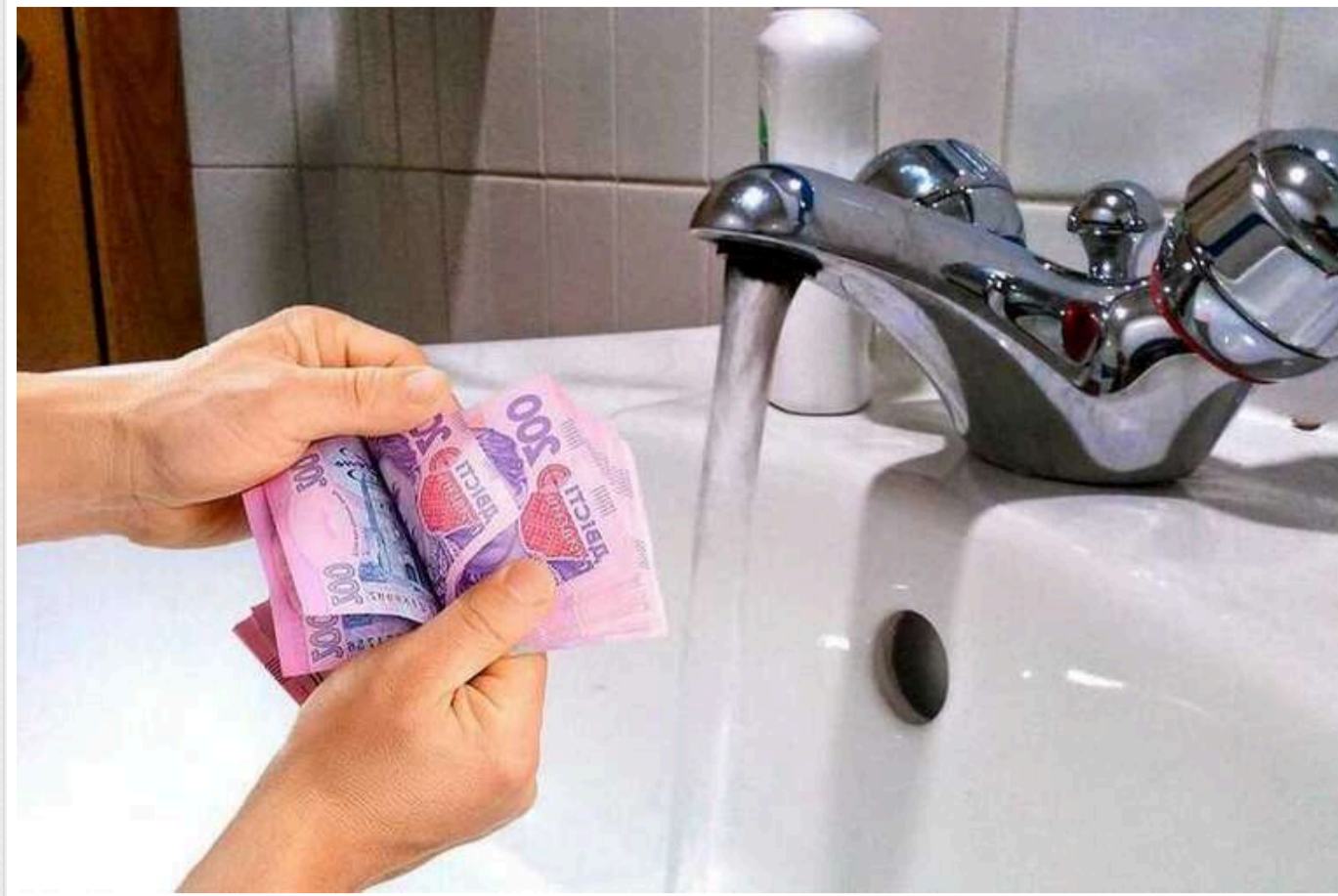
Українцям підвищать тарифи на воду - на 55%

Тариф на водопостачання у великих містах не переглядався вже кілька років, і з поточними цінами водоканали не можуть виконувати свої функції.