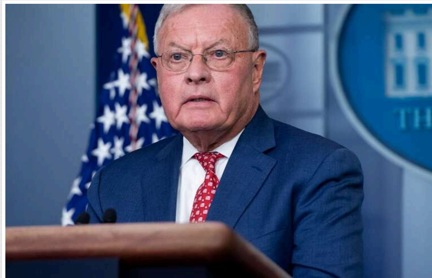
Спецпредставник Трампа Келлог може також відвідати Москву, - Bloomberg

Спеціальний представник Трампа Келлог, який планує візит в Україну, може також відвідати Москву.