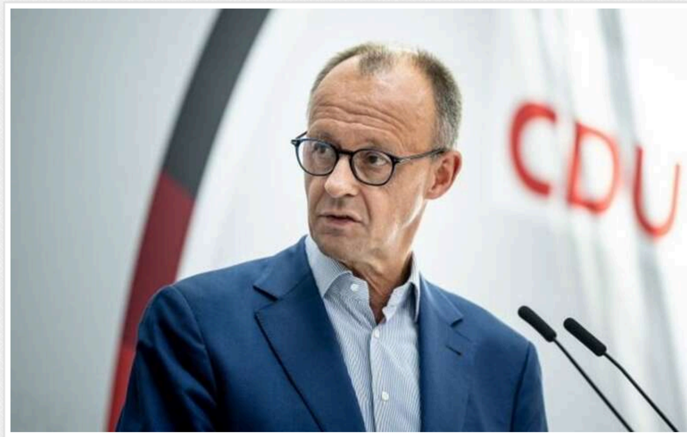
Поки триває війна, Україна не зможе стати кандидатом на вступ до НАТО, - Мерц

Україна не зможе отримати статус кандидата на вступ до НАТО, поки в країні тривають воєнні дії.