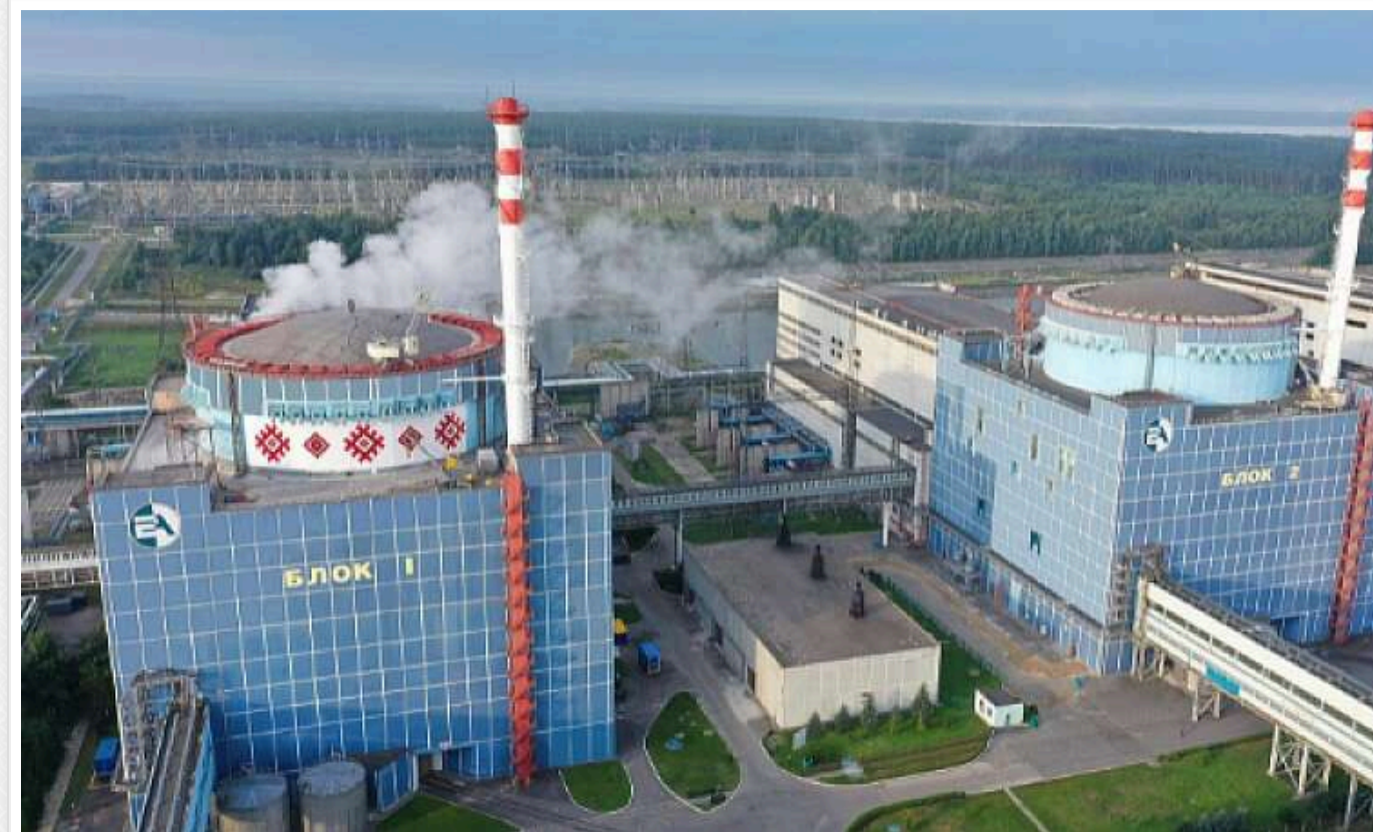
Експосол Гербст: Добудова енергоблоків №3 і №4 Хмельницької АЕС сприятиме енергетичній незалежності України та співпраці зі США

Колишній посол США в Україні (2003-2006) і старший директор Євразійського центру Atlantic Council Джон Гербст апевнений, що завершення будівництва енергоблоків №3 і №4 Хмельницької АЕС зміцнить співробітництво між Україною та США в галузі ядерної енергетики й сприятиме енергетичній незалежності країни.