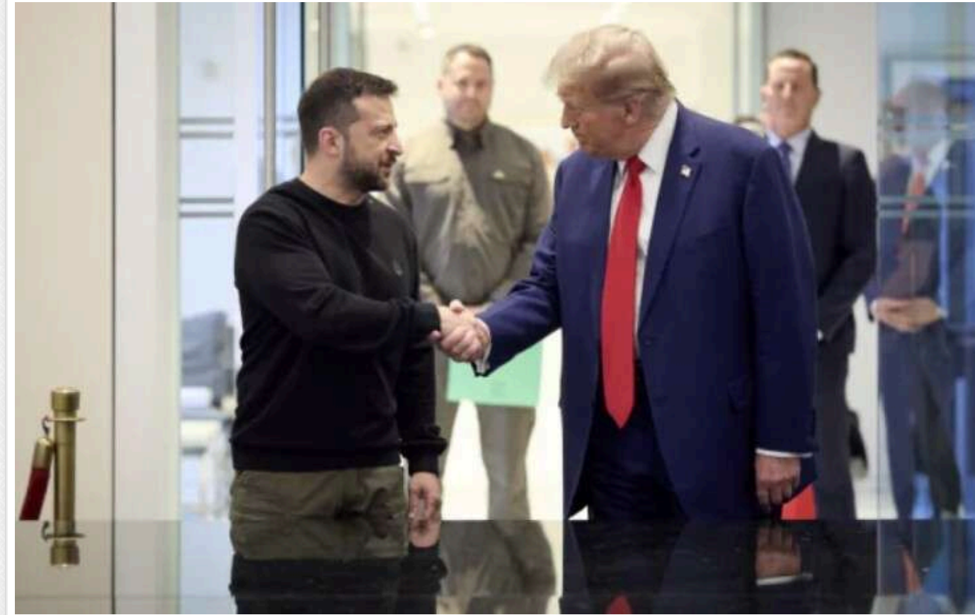
Bloomberg: Трамп може схвалити угоду щодо України, яка залишає окуповані території під контролем Кремля

За словами новообраного президента США, Україні необхідна угода для припинення війни. Позиція адміністрації Джо Байдена полягає в тому, що лише Володимир Зеленський може ухвалювати рішення про початок переговорів.