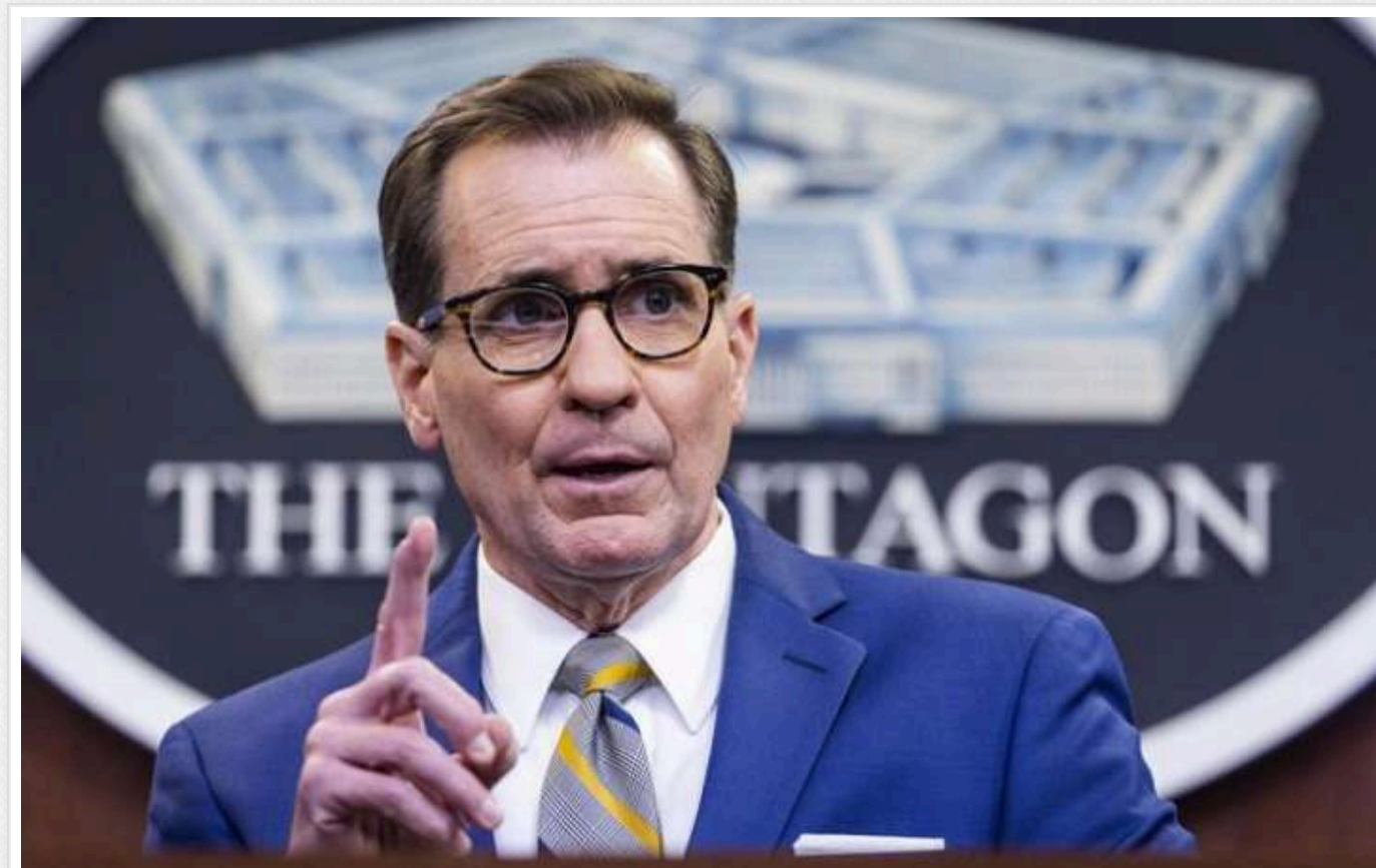
В адміністрації Байдена прокоментували позицію Трампа стосовно ймовірних переговорів між Україною та Росією

Президент України Володимир Зеленський має самостійно вирішувати, коли та за яких умов розпочинати переговори. Джо Байден спрятиме цьому до закінчення свого президентського терміну.