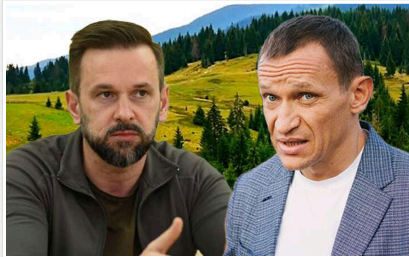
Старі зв'язки, нові схеми: як на Закарпатті роздають землю під бізнес "для своїх" за копійки

Під час повномасштабної війни відносно безпечно Закарпаття переживає справжній "будівельний бум". А де великі будівництва й великі кошти – там і великі схеми.