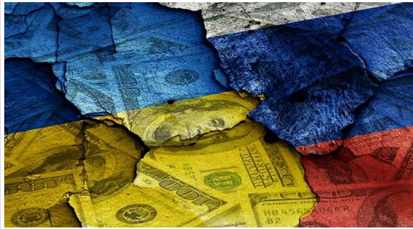
Понад 40 тисяч українських компаній мають прями або опосередковані зв'язки з Росією

40 094 українських компаній та 836 ФОПів, які є власниками бізнесу в Росії або перереєстрували свої компанії під час війни, мають опосередкований зв'язок з РФ за результатами факторів "Експрес-аналізу" YouControl.