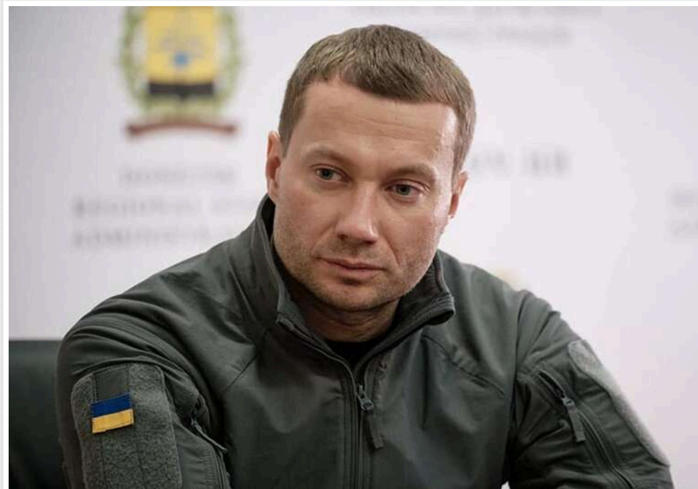
Суд дозволив зняти із голови АМКУ Кириленка електронний браслет

Вищий антикорупційний суд зняв електронний браслет і дозволив вільно пересуватися Україною голові Антимонопольного комітету Павлу Кириленку. НАБУ і САП підозрюють його у незаконному збагаченні на 72,1 млн грн, а також у недостовірному декларуванні.