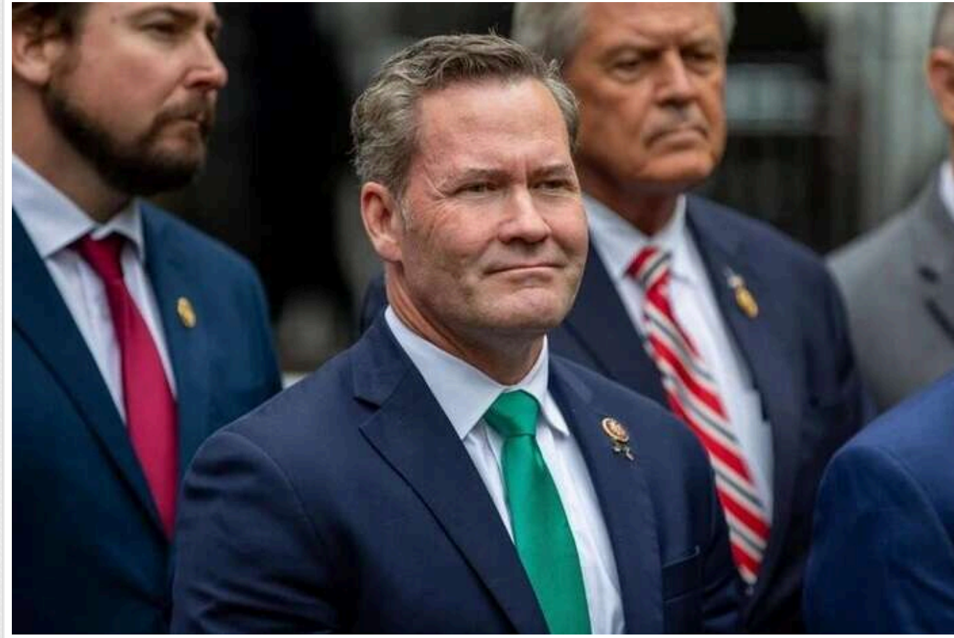
Волтц: "Ми думаємо, як зупинити війну назавжди, а не просто призупинити"

Конгресмен з Флориди Майк Волтц, якого обрано президентом США Дональдом Трампом як майбутнього радника з питань національної безпеки, заявив, що у команді Трампа працюють над стратегією припинення війни Росії проти України, а не лише на тимчасове призупинення конфлікту.