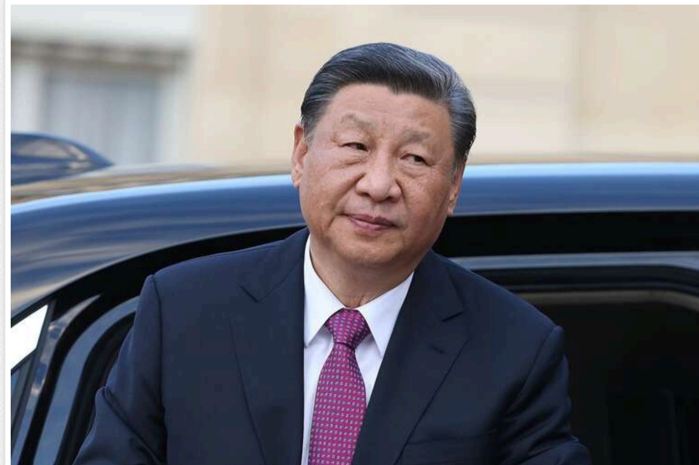
Експерти з геополітики розповіли про прагнення Сі Цзіньпіна протистояти США та «глобальному світовому порядку»

У своєму прагненні протистояти США та «глобальному світовому порядку» лідер Китаю Сі Цзіньпін знаходить натхнення в романі російського письменника Чернишевського «Що робити?».