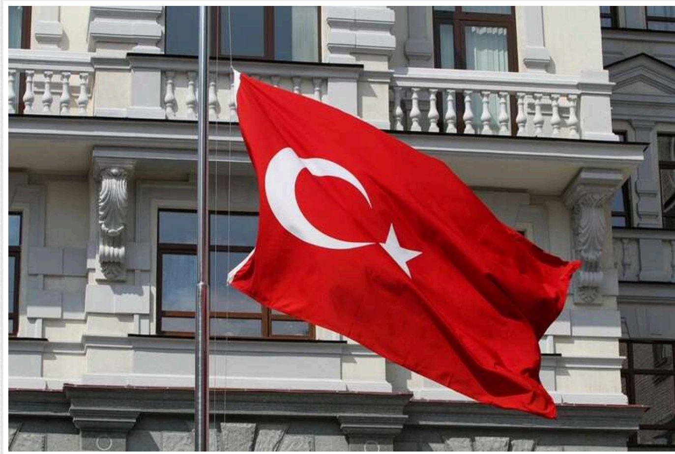
Туреччина відправляє 80 рятувальників до найбільшої військової тюрми Сирії

Турецьке агентство з ліквідації наслідків стихійного лиха (AFAD) організувало пошуково-рятувальну операцію у військовій в'язниці Седная в Сирії, де можуть бути заблоковані люди.