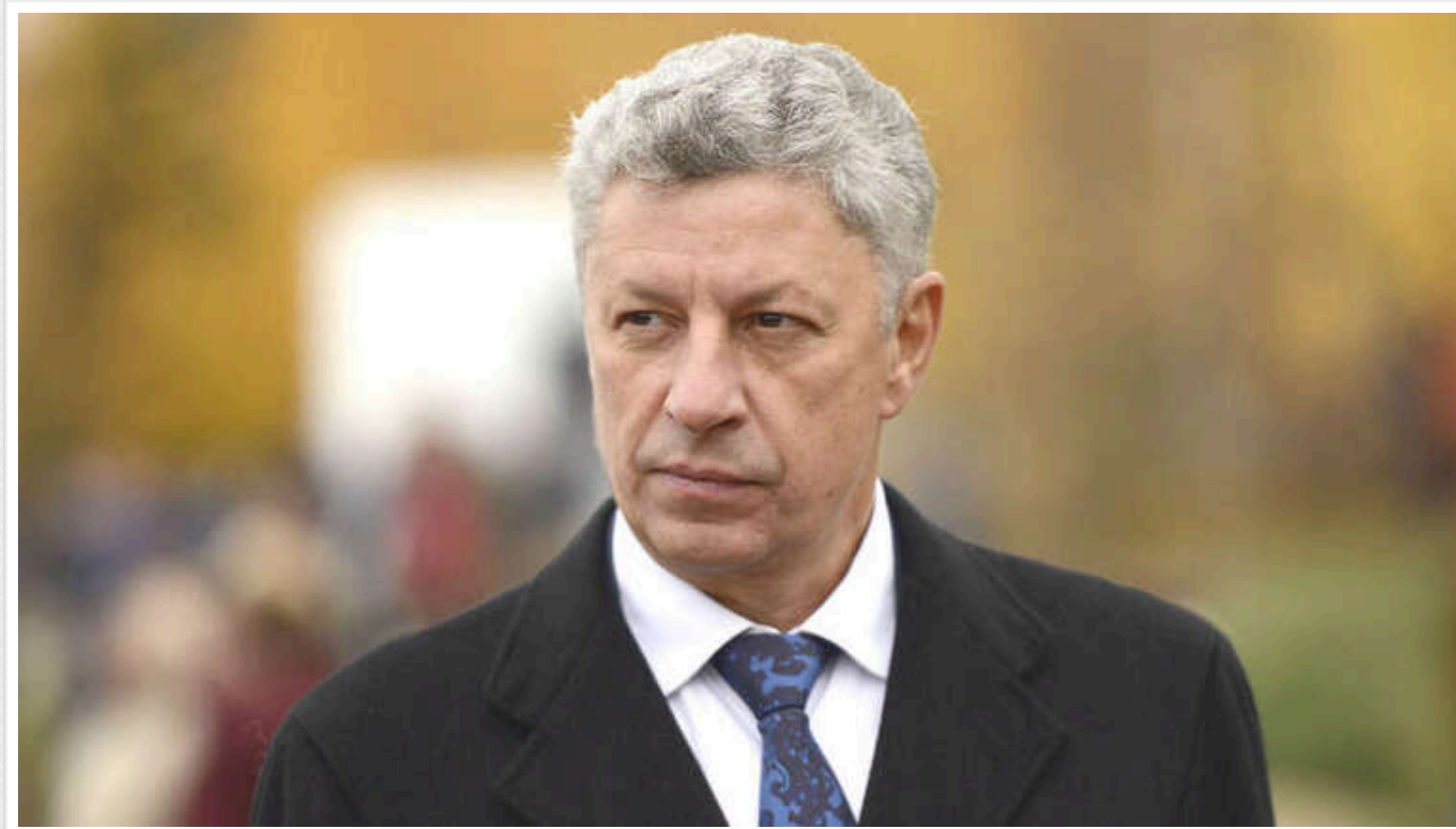
Бойко досі впливає на долю країни проросійськими наративами, - ЗМІ

Бойко роками потрапляє у різні корупційні історії. Проте досі залишається «невидимкою» для правоохоронних органів.