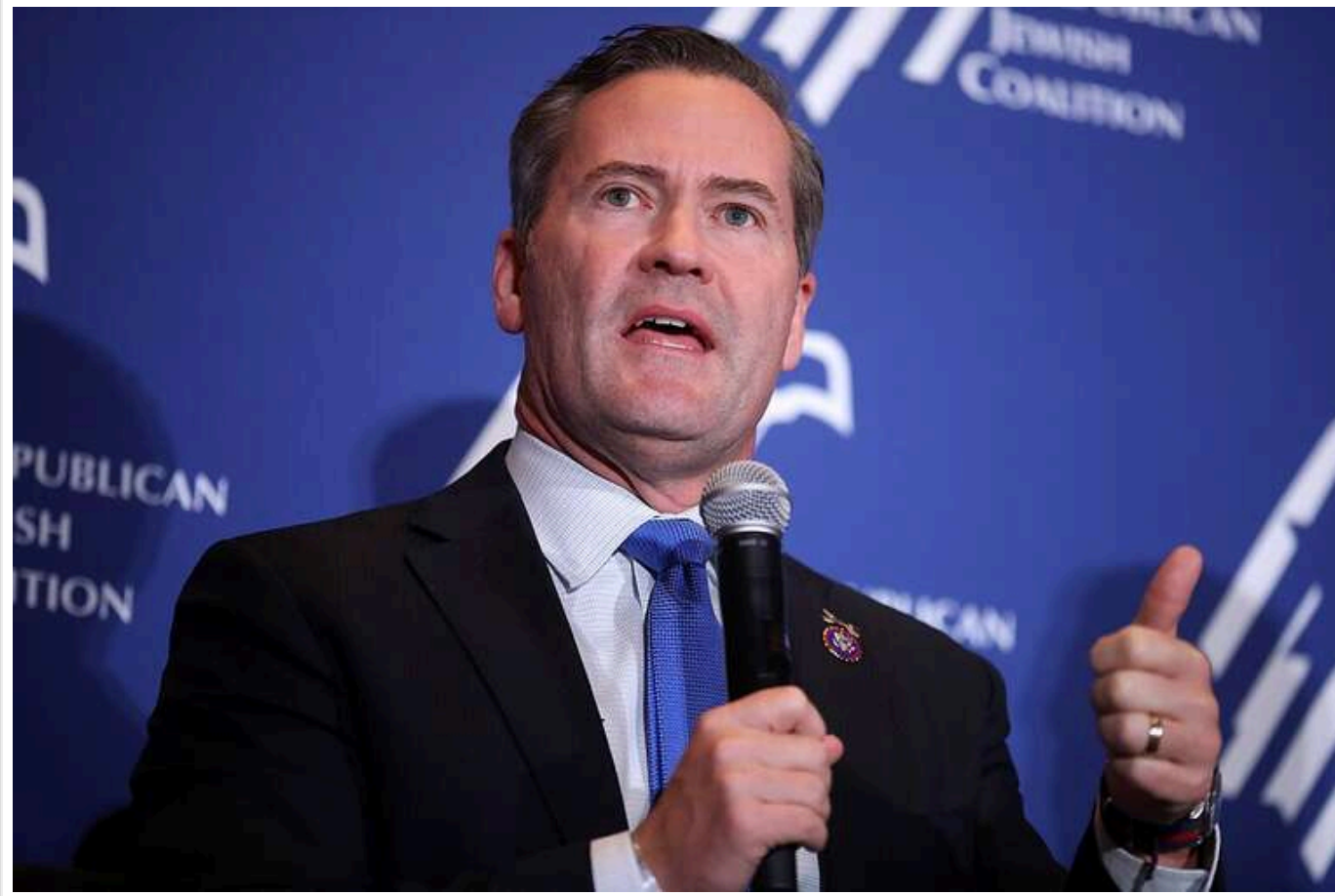
В оточенні Трампа хочуть «ретельно розглянути» пропозиції Орбана щодо припинення вогню в Україні

Про це повідомив Майк Волтс, радник новообраного президента з національної безпеки, в ефірі телеканалу CBS у відповідь на запитання щодо пропозицій угорського прем'єра.