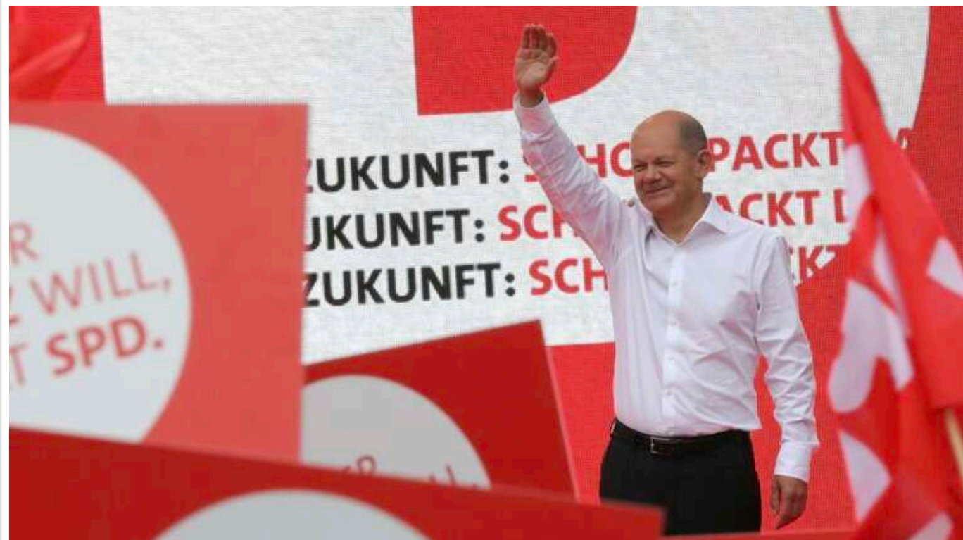
У Німеччині партія Шольца у передвиборчій програмі вкаже на відмову від Тагус для України, - ЗМІ

Соціал-демократична партія під керівництвом нинішнього канцлера Німеччини Олафа Шольца у своїй передвиборчій програмі може окремо зазначити відмову в передачі Україні далекобійних ракет Тагус.