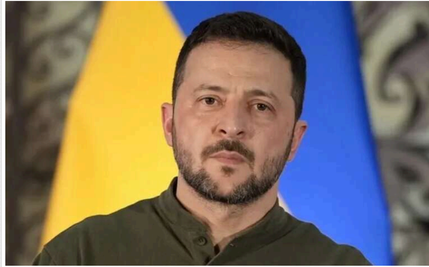
Президент Зеленський незабаром зустрінеться з лідерами Євросоюзу

Президент Володимир Зеленський 18 грудня відвідає Брюссель (Бельгія) для переговорів з лідерами Великої Британії, Франції, Німеччини, Італії, Польщі, НАТО та ЄС. Основною темою буде підтримка України у війні з Росією.