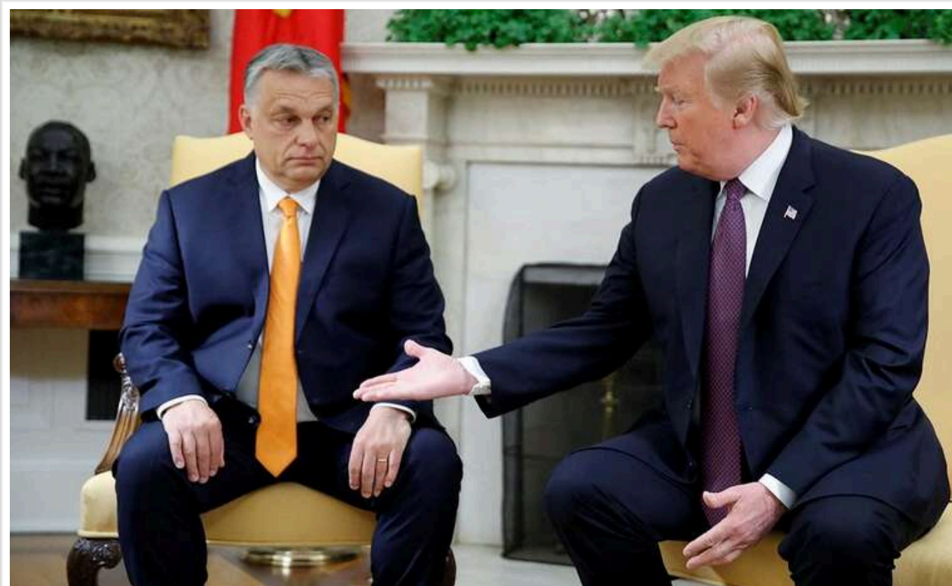
За допомогою Орбана Трамп шукає варіанти завершення війни

Дата 20 січня, день інавгурації новообраного президента США Дональда Трампа, підтоховує його до більш активних дій щодо затвердження плану розв'язання проблеми війни в Україні. В останні дні спостерігається значне поквавлення в питанні обговорення варіантів завершення війни. Перший раунд обміну думками відбувся в Парижі, де за підтримки французького президента Макрона зустрілися Дональд Трамп та президент України Володимир Зеленський.