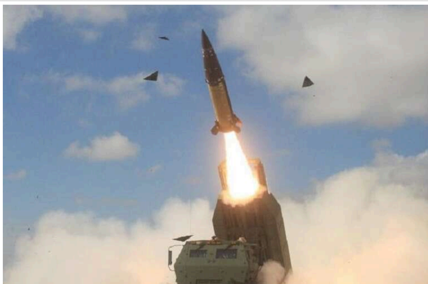
Після ударів АТАСМС і Storm Shadow по Росії війська Путіна вдвічі знизили інтенсивність бомбардувань КАБами

З 20 листопада Росія знизила більш ніж удвічі інтенсивність ударів по Україні керованими бомбами. Якщо на початку останнього місяця осені щоденно окупанти скидали понад 100 бомб, то у грудні ця кількість знизилася до 24-50 за добу.