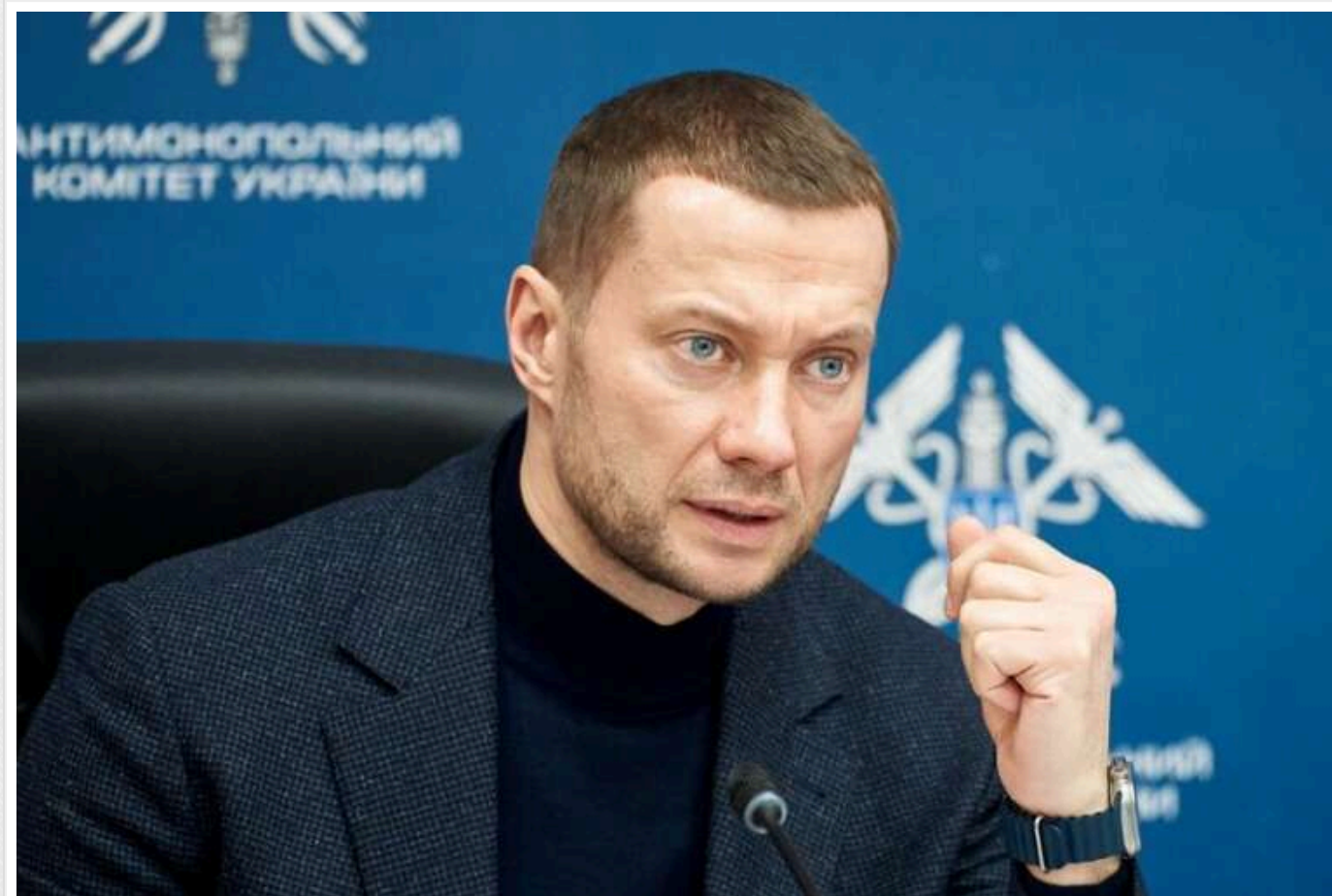
Голова АМКУ Кириленко планував відправитися у відрядження, проте суд йому відмовив

Вищий антикорупційний суд не дозволив голові Антимонопольного комітету Павлу Кириленку їхати у закордонне відрядження до Парижа, Франція, на заходи Організації економічного співробітництва та розвитку (ОЕСР) у період з 2 по 6 грудня.