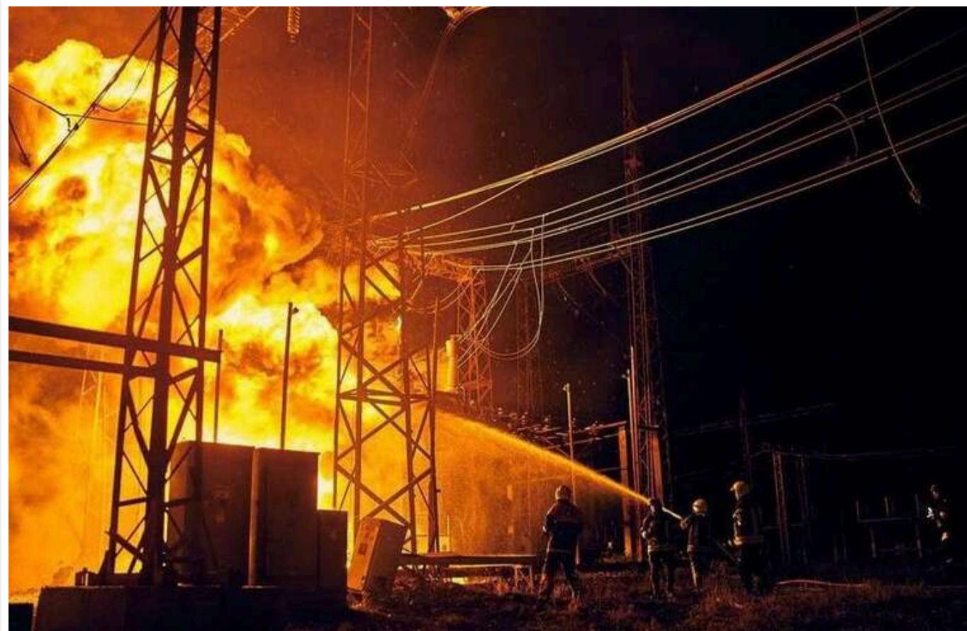
Росія здійснює атаки на енергетичний сектор, – Міненерго

Вранці 13 грудня Росія завдає масованого удару по українській енергетиці, повідомив міністр енергетики Герман Галущенко.