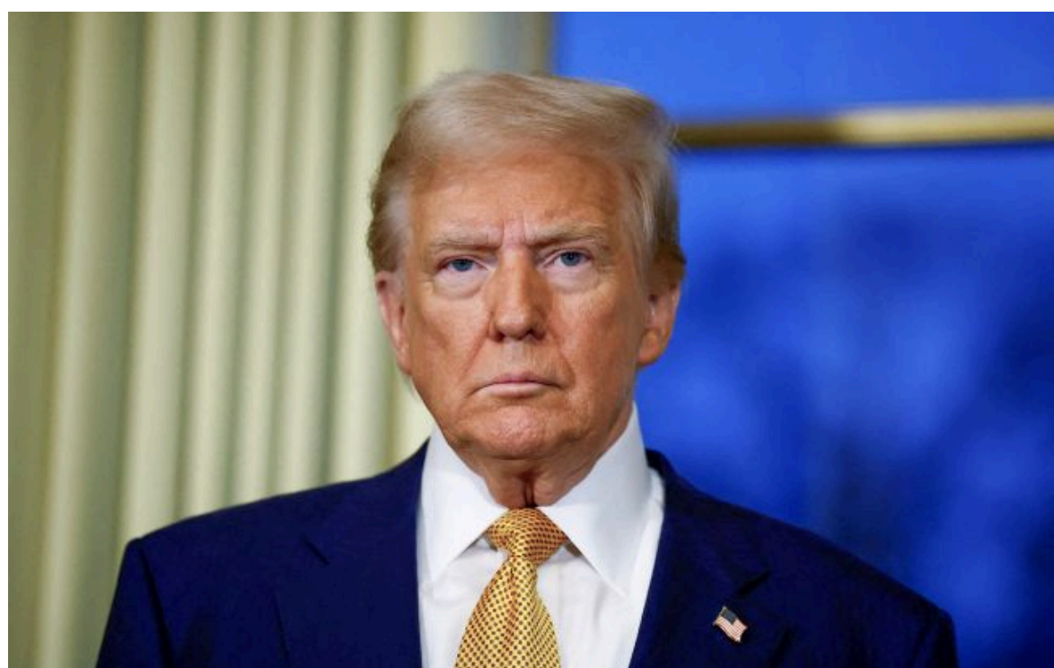
Фото: Дональд Трамп

Не витрачай час на шум! Читай тільки суть з РБК-Україна у Google