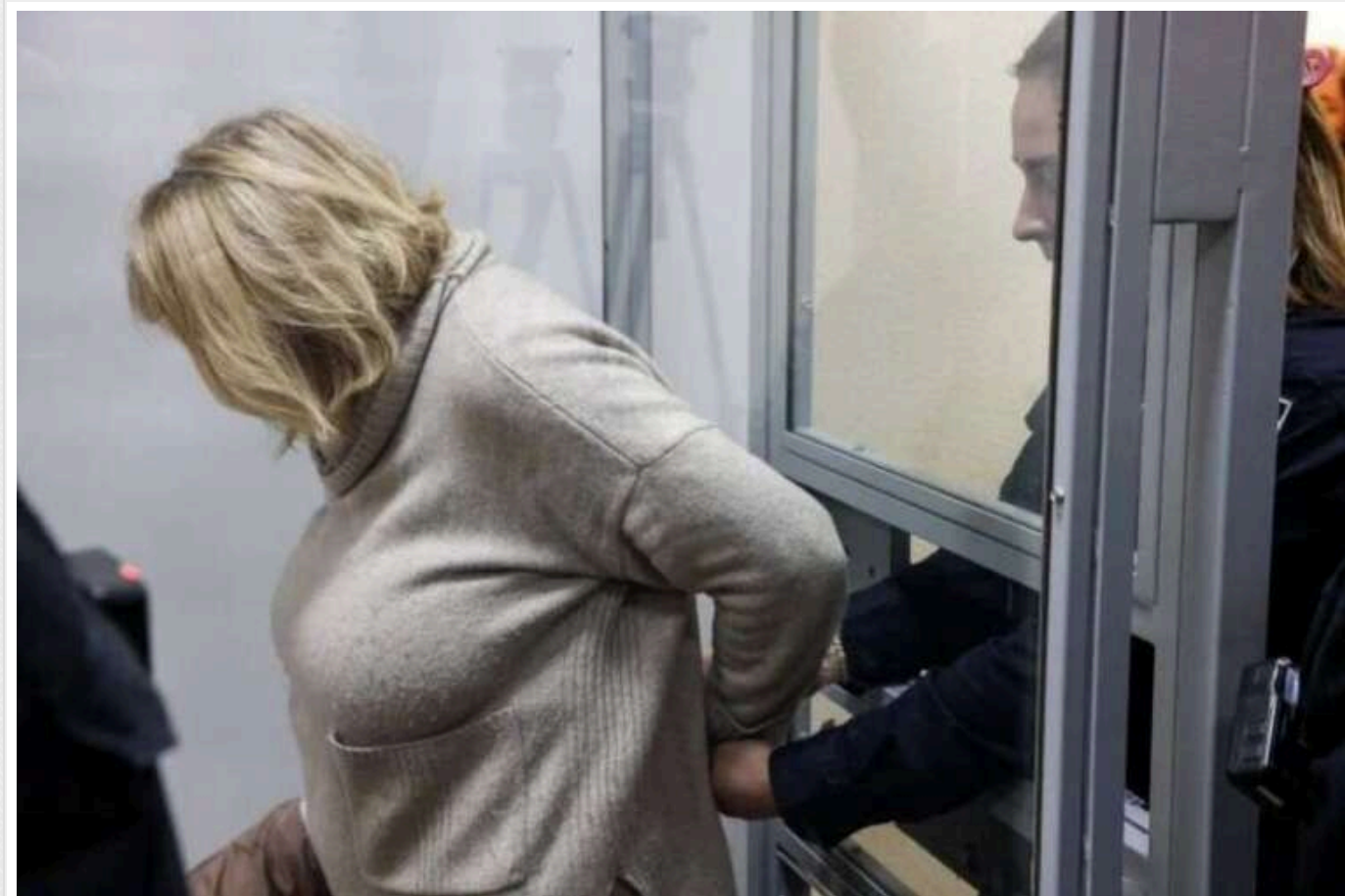
Корупція в Хмельницькій МСЕК: З ким спілкувалася Крупа і що знайдено в її айфоні

Адвокати підозрюваної голови МСЕК Хмельницької області намагалися оскаржити арешт її майна.