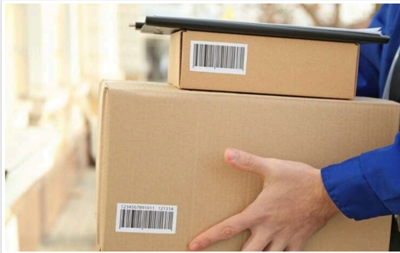
В Україні Поліції хочуть дозволити відкривати посилки українців без їхнього відома

Українським правоохоронцям можуть надати можливість відкривати не лише кореспонденцію громадян, але й поштові відправлення. При цьому арешт на посилки накладатимуть без відома особи-адресата.