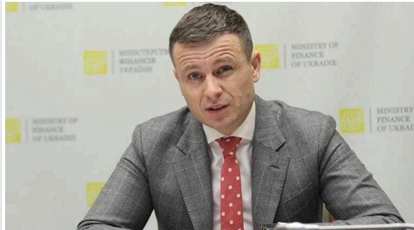
Марченко розповів, як довго Україна зможе тримати оборону в разі припинення допомоги від Штатів

Міністр фінансів України Сергій Марченко вважає, що Україна має "достатньо коштів і зброї, щоб чинити опір принаймні впродовж першої половини 2025 року", навіть якщо допомога від Вашингтона буде припинена.