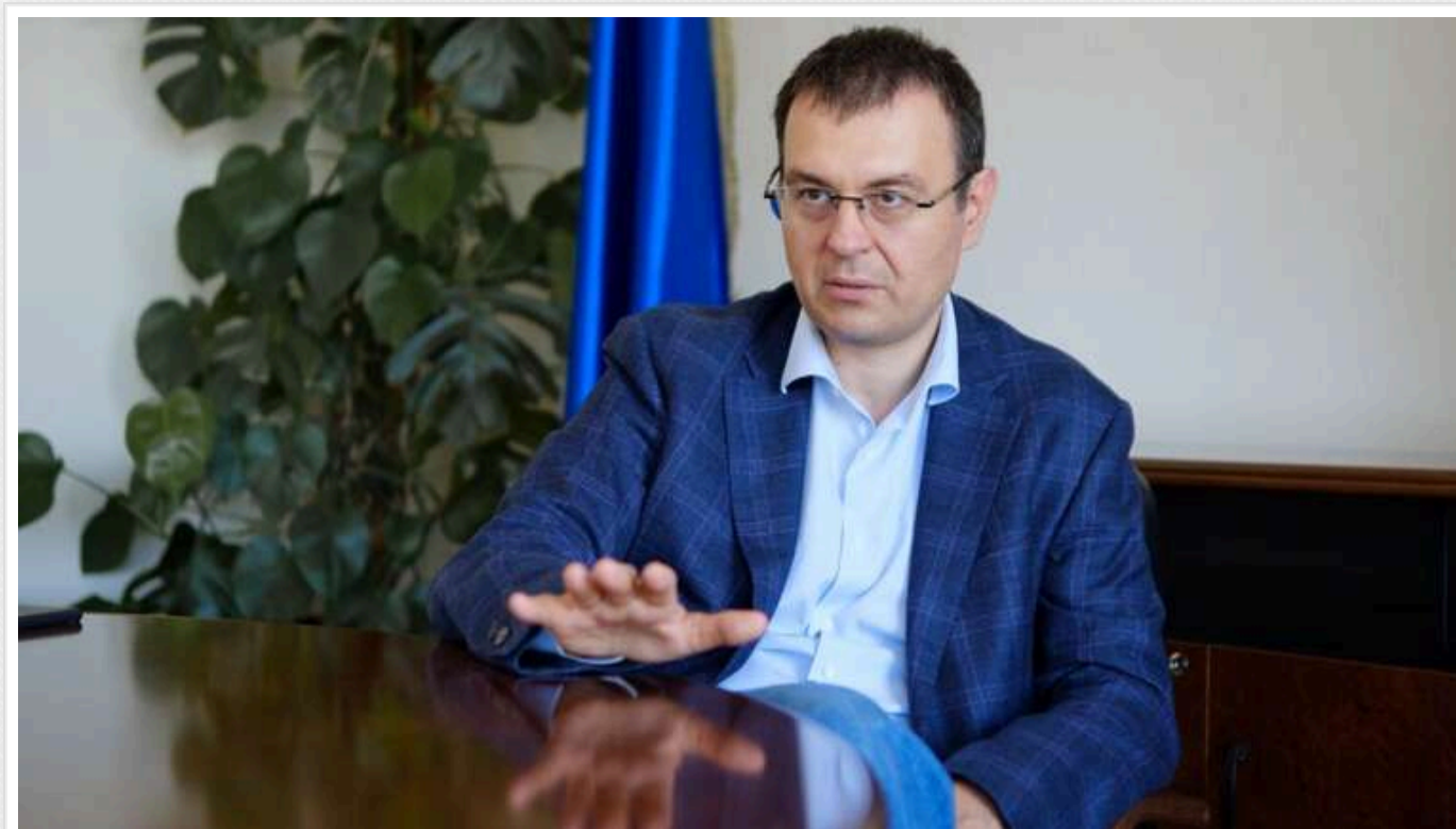
Україна скасує військовий збір у розмірі 5%, - Гетманцев

Військовий збір залишиться в Україні після війни, але ставка автоматично повернеться до 1,5% після скасування воєнного стану. Наразі тимчасово підвищена ставка до 5% допомогла зібрати понад 40 млрд гривень для підтримки армії та бюджету країни.