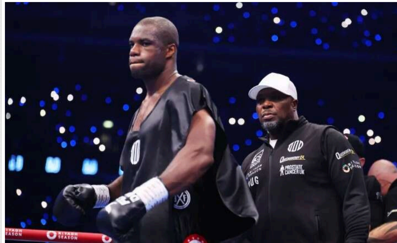
Дюбуа перед реваншем Усика з Ф'юрі пригрозив українцю

Чемпіон Британії Даниель Дюбуа (22-2, 21 КО) має чіткий намір зустрітися в поєдинку з переможцем реваншу між Олександром Усиком (22-0, 14 КО) та Тайсоном Ф'юрі (34-1-1, 24 КО).