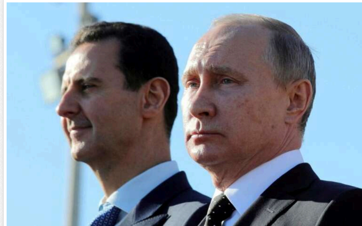
Bloomberg: Путін вимагає від своєї розвідки пояснень, чому вона не побачила загрози правлінню Асада

Президент Росії Володимир Путін вимагає від своєї розвідки пояснення, чому вона не зауважила підвищення загрози режиму Башара Асада в Сирії, поки не стало занадто пізно.