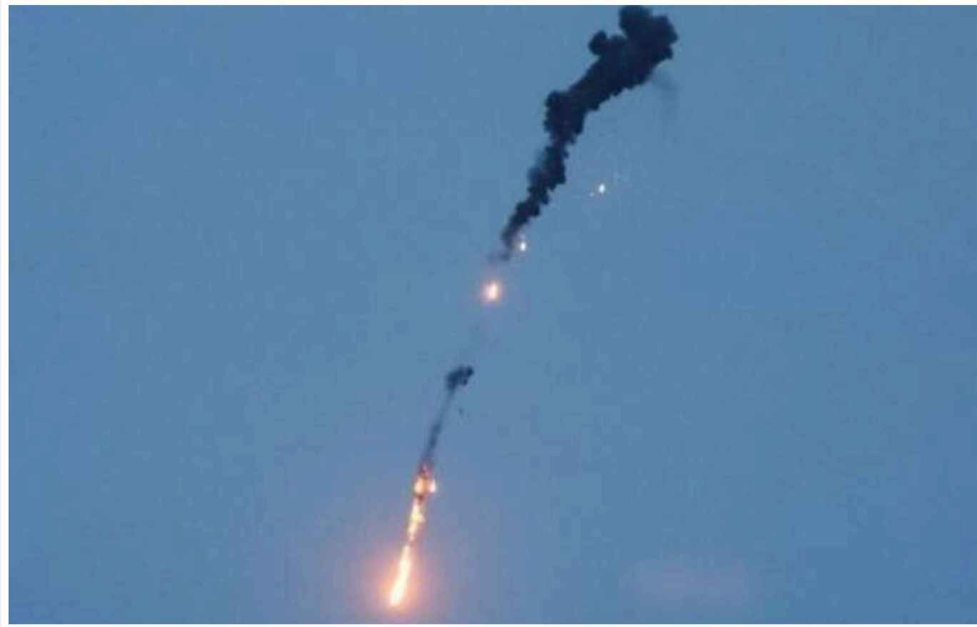
Сили ППО на Дніпропетровщині збили 2 ракети, – ОВА

Вранці 11 грудня в Дніпропетровській області активізувалися сили протиповітряної оборони.