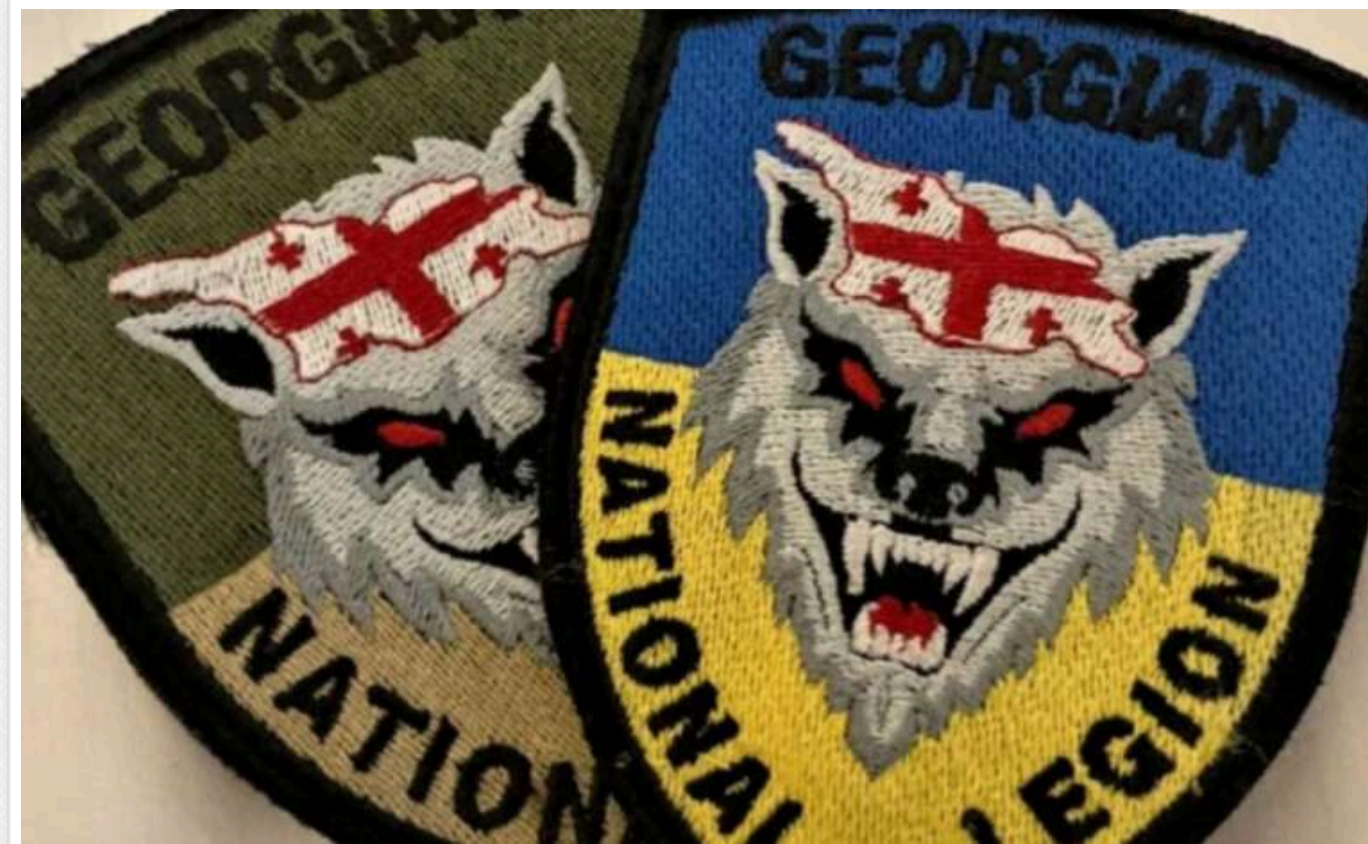
У Росії заочно засудили ще двох грузинських бійців, які воювали в складі ЗСУ